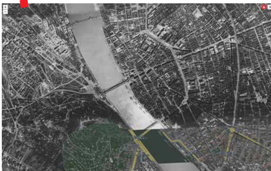
Zračne snimke Budimpešte

Osnovu lokalnog Time Machine-a čini skup georeferenciranih i vektoriziranih povijesnih karata visoke rezolucije, koje omogućavaju povezivanje izvora i podataka na razini najmanjih prostornih jedinica – mjesta, zgrada i kuća, a ponekad čak i unutar njih. Tako su vremenski „slojevi“ uvjetovani nasljeđem mapiranja pojedinih mjesta i gradova, odnosno razdobljem iz kojega potječu karte dobre kvalitete, što znači u mjerilu manjem od 1:5000 ili optimalno 1:2000. Budimpeštanski Time Machine u ovom trenutku ima četiri vremenska sloja temeljena na detaljnim povijesnim kartama iz razdoblja prije